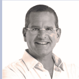
Pedro R. Pierluisi